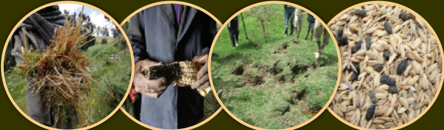
ኣናፁ ኣብ ሕርሻ ኮነ ድሕሪ ምእካብ ምህርቲ ብምብላዕ፣ ብምብልሻውን ብምብካል/ምርከስ/ን እቶት ምህርቲ ይቕንሳ።

እዚ ስግኣት ብምፍጥሩ ምኽንያት ነቲ በቢእዋኑ ዝርከብ ምህርቲ ኣብ ሕርሻ ቦታ ኮነ ኣብ መኸዝን ብኣናፁ ጥቕዓት ንኸይፍጠር ዝኣተወ ምህርቲ ምዕቃብ እቲ ቀዳማይ ሜላ ምክልኻል ይኸውን። ነናጎኒ እዚ ድማ ብተሸካምነት ኣናፁ ከም እኒ ላሳን ሃንታን ዝተበሃሉ ሽይረሳትን ካልኣት መንቀልቲ ልዕሊ 60 ዝተፈለለዩ ሕመማትን ዝኾኑ ታህቦስያንን ምቕለስ ኣዝዩ ኣገዳሲ ኮይኑ ይርከብ። እዚ ስነ ምህዳራዊ አተኣላልያን ቁፅፅርን ኣናፁ ምስ ካልኣት ሜላታት ቁፅፅር ብምውህሃድ ብፅርዮትን ዓቕንን ዝሓሸ ምህርቲ ሕርሻ ጥራይ ዘይኮነስ ምቸው ኩነታት መነባብሮ ንኸህሉ ባይታ ይፈጥር።